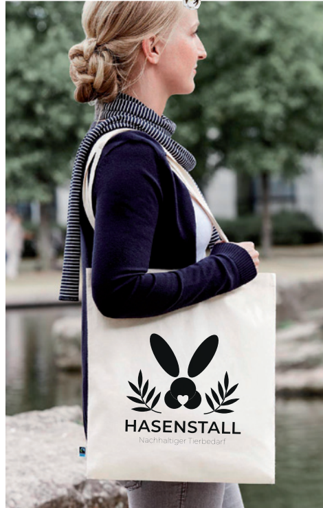
Beispiel Shopper ORGANIC (283 g/m 2 ) mit Siebdruck