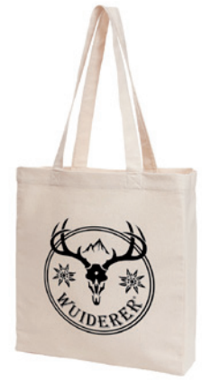
Shopper ORGANIC mit Bodenfalte 36 x 40 x 10 cm (283g/m 2 )