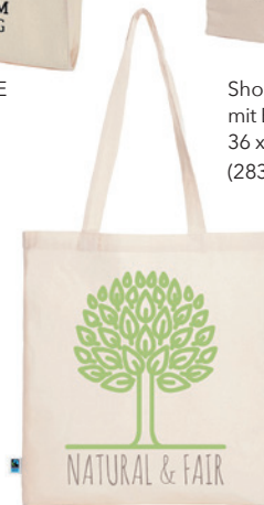
Shopper FAIR ohne Bodenfalte 38 x 42 cm (140g/m 2 )