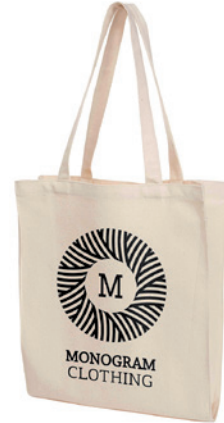
Shopper NATURE mit Seitenfalten 34 x 37 x 13 cm (283g/m 2 )

* Wir empfehlen eine zweite Druckfarbe als Unterlegung. Auf Anfrage erhalten Sie ein individuelles Angebot.