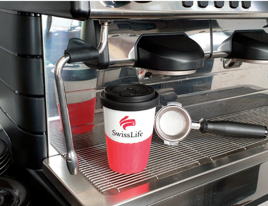
Coffee-TO-GO-Becher WAVE, Beispiel Teildekor