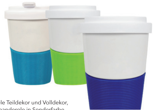
Beispiele Teildekor und Volldekor, Silikonbänderole in Sonderfarbe ab 500 Stück möglich

Angebot freibleibend, Preise zzgl. MwSt. ab Werk, Irrtümer vorbehalten. Bitte senden Sie uns Ihre druckfähigen PDF- oder EPS-Daten inklusive Pantone Farbangaben zu.