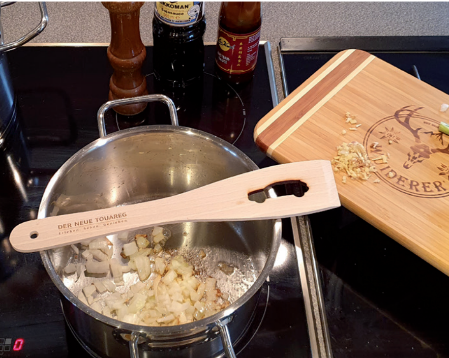
Pfannenwender aus Buchenholz, Beispiel Laserschnitt auf Laffe und Lasergravur auf Griff