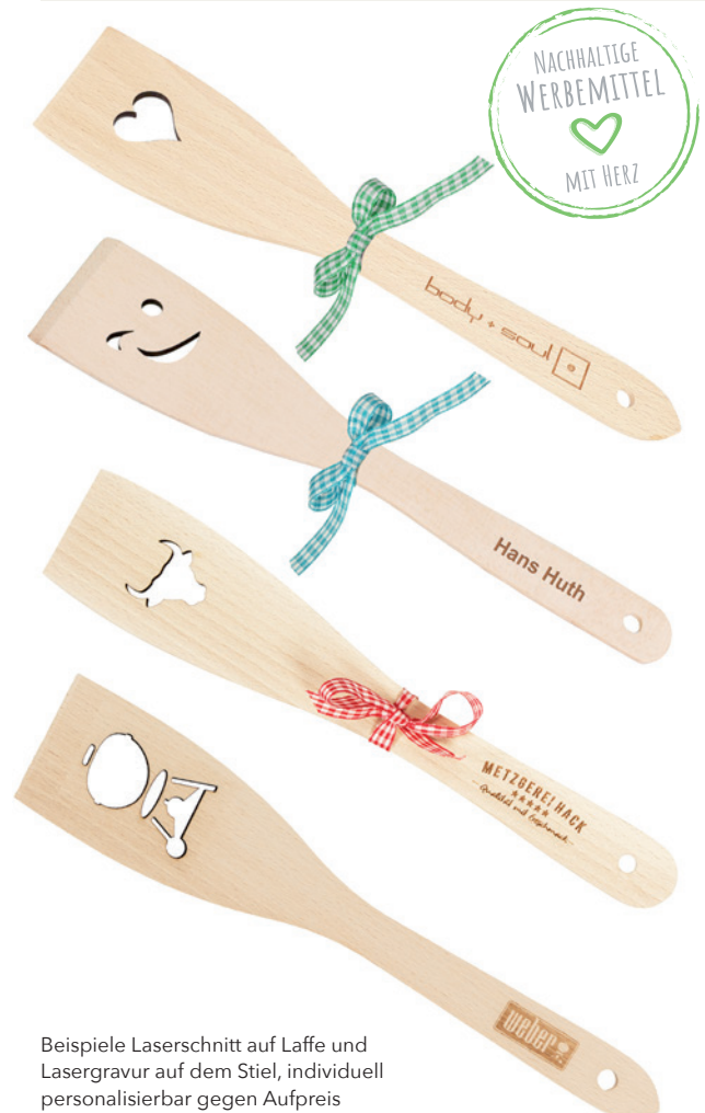
Beispiele Laserschnitt auf Laffe und Lasergravur auf dem Stiel, individuell personalisierbar gegen Aufpreis

Unser Produkt online: « Bitte hier scannen!