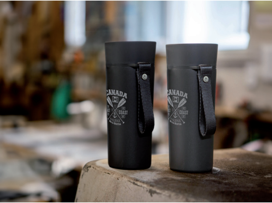
Thermosbecher TORONTO aus Edelstahl, Beispiel Lasergravur