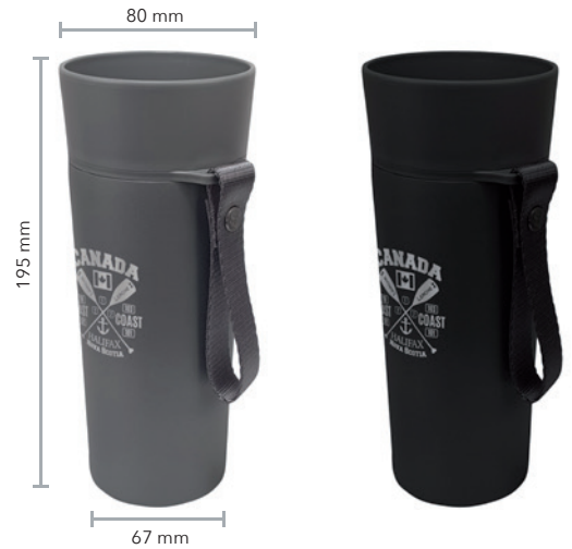
Edelstahl Trinkbecher to Go mit praktischem Trageband